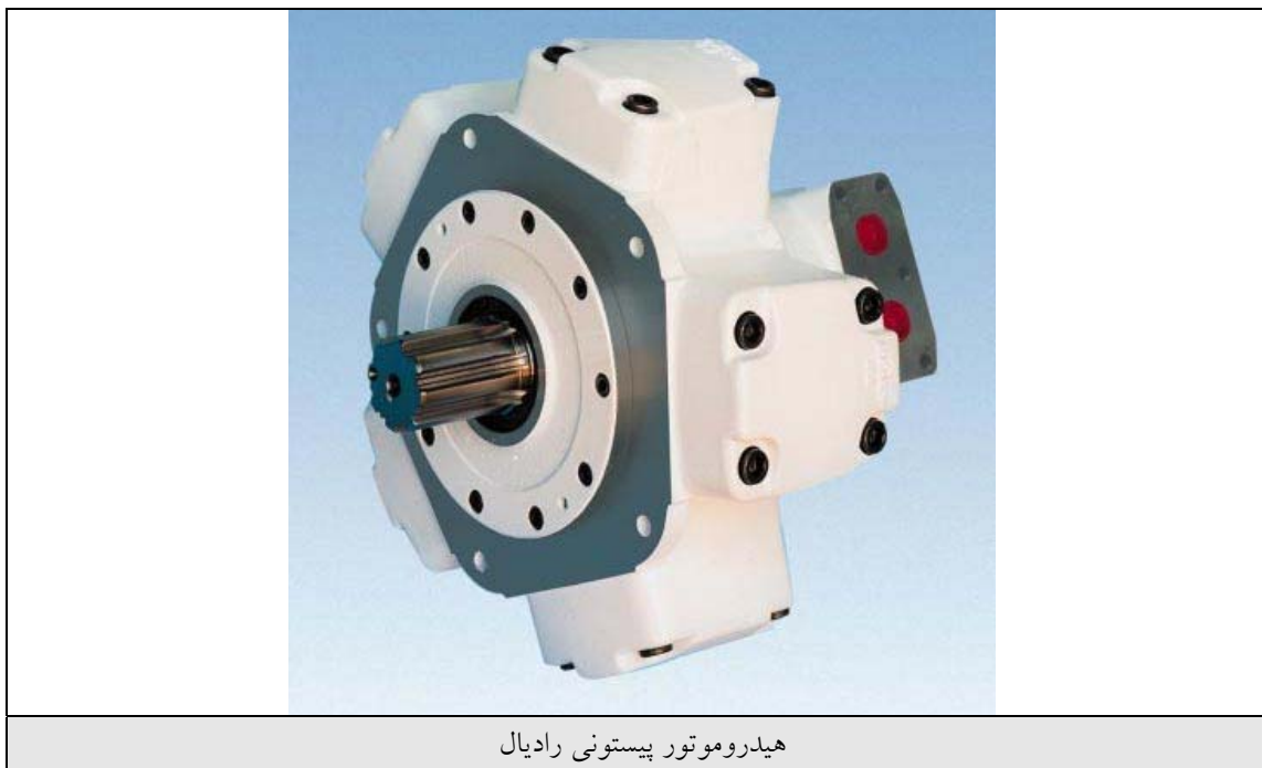
هیدروموتور پیستونی رادیال

محدوده سرعت دورانی هیدروموتور توسط طراح ماشین تعیین میگردد. طراح سیستم هیدرولیک با استفاده از سرعت دوران هیدروموتور و با توجه به حجم جابجائی آن، مقدار دبی پمپ هیدرولیک و نهایتاً توان الکتروموتور یا واحد تامین قدرت مربوطه را مشخص مینماید.