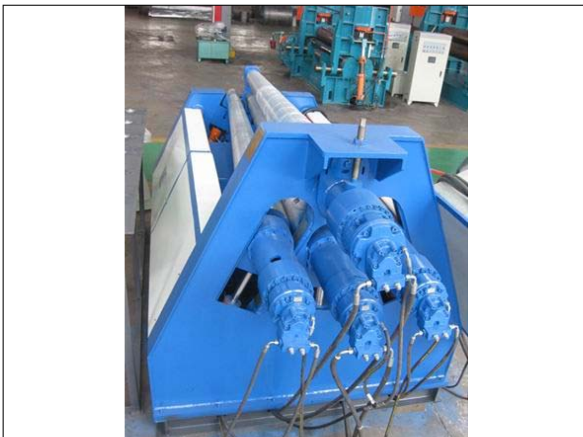
ترکیب هیدروموتور و گیربکس در دستگاه نورد

برای افزایش گشتاور هیدروموتورها (مانند موتورگیربکسها) میتوان از انواع مختلف گیربکسهای کاهنده دور استفاده نمود. به خاطر داشته باشید گشتاور خروجی گیربکس به نسبت کاهش دور خروجی، افزایش میابد. بنابراین در صورتیکه ماشین مورد نظر شما به 3000\text{N.m} گشتاور در دور 50\text{rpm} نیاز دارد به جای استفاده از یک هیدروموتور بزرگ میتوانید از یک هیدروموتور با خروجی 300\text{N.m} و یک گیربکس کاهنده 1 به 10 استفاده نمایید. در اینجا لازم است محاسبات پمپ این سیستم برای دور 500\text{rpm} تعیین گردد تا پس از کاهش دور توسط گیربکس به دور مطلوب برسیم. البته این موارد به صورت ایده آل و بدون در نظر گرفتن راندها مکانیکی و حجمی پمپ و هیدروموتور بیان شده است و این درحالیست که معمولاً طراح سیستم هیدرولیک افتهای موجود در مسیر انتقال قدرت را در محاسبات مربوطه در نظر میگیرد.